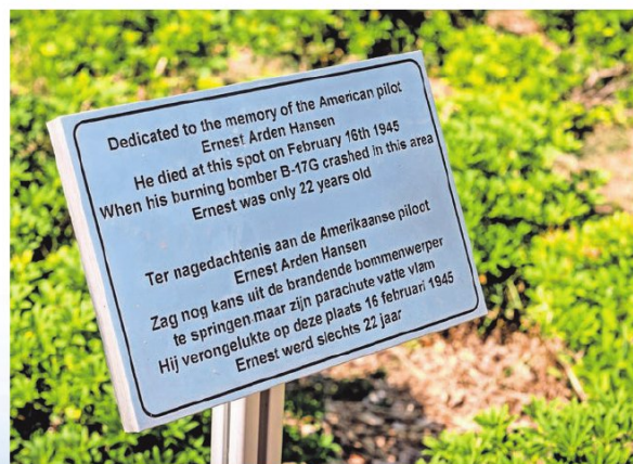
◀ Op de plek waar Hansen verongelukt staat sinds vorig jaar juni een plaquette met deze tekst.